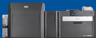
Impresora/codificadora a doble cara con opción de laminación